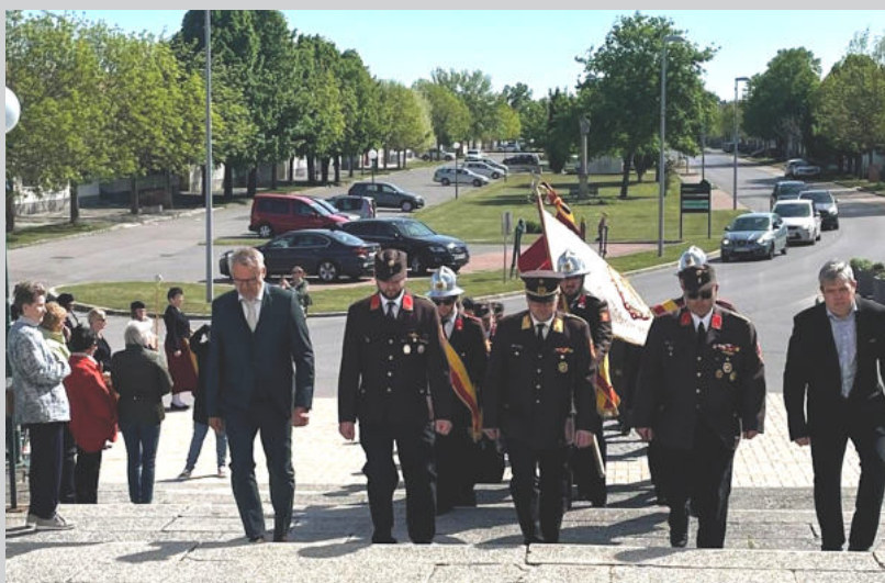
Hl. Messe am 26. April mit der Freiwilligen Feuerwehr St. Andrä am Zicksee