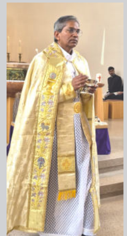
Messfeier nach Syro-Malabrischem Ritus