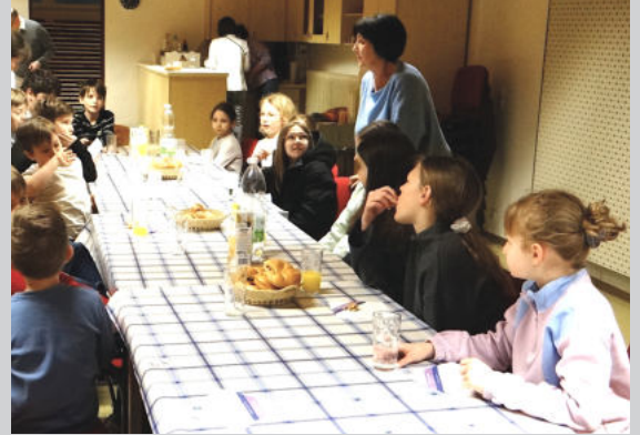
Die Feier der Osternacht