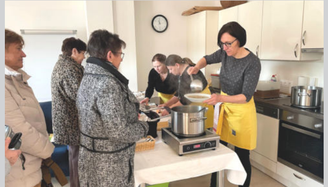
Vielen Dank für Ihre Spende von € 800 beim Fastensuppenessen der Kath. Frauenbewegung am 1. März!