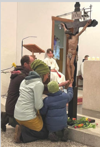
Triduum Sacrum - Die Drei Österlichen Tage