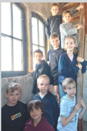
Die Erstkommunionkinder im Kirchturm am 5. Mai